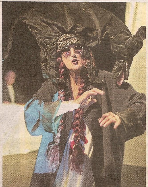
En el montaje participan actores, dramaturgos y directores.